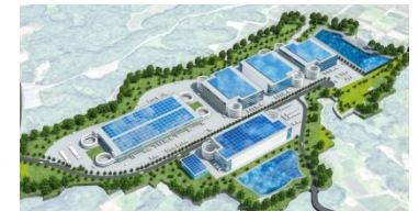
ヒューリック社の物流施設イメージ

鎌ヶ谷本埜線バイパス開通のメリットの一つは、北千葉道路と並行する印西⇄成田のルートとなること。北千葉道路では吉高交差点