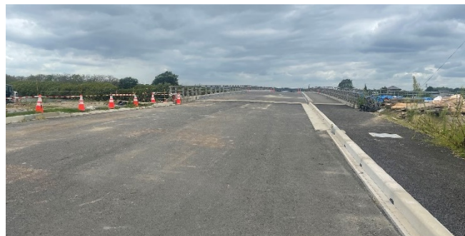
県道鎌ヶ谷本埜線バイパス(栄町安食)

そのような中、今年4月ようやく架橋の本体工事が終了。一部区間の舗装や交通標識、表示等の整備が残るものの、来年3月の開通見込みが立