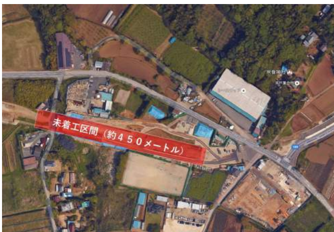
千葉 NT 北環状線の未着工区間 (白井市)